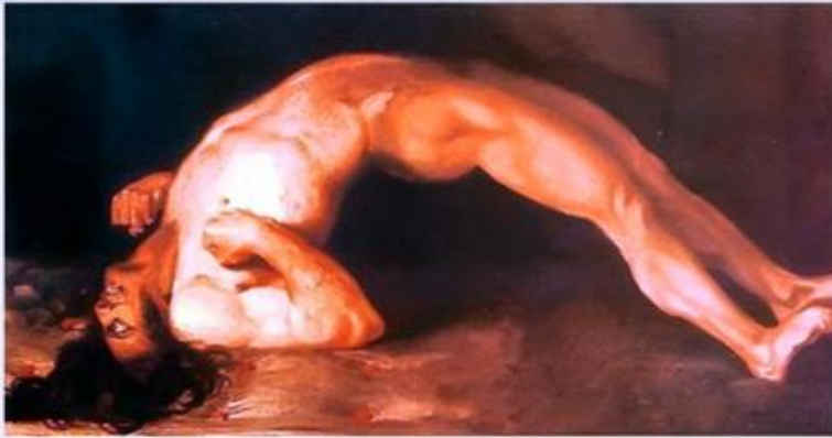
Опистотонус - судорожное сокращение всей скелетной мускулатуры при столбняке